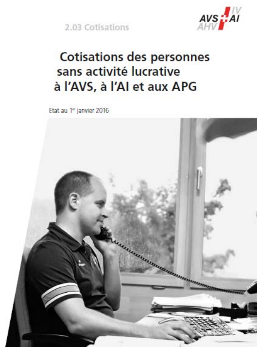
8 Table des cotisations des personnes sans activité lucrative

https://www.ahv-iv.ch/fr/Mémentos-Formulaires/Mémentos